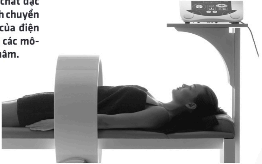
Máy chụp ảnh cộng hưởng từ MRI

Khả năng ứng dụng thứ hai của từ trường là ghi lại sự thay