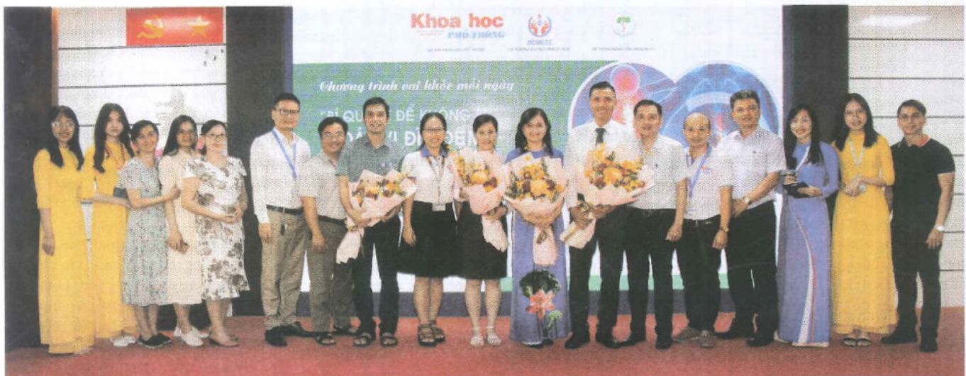
Chương trình vui khỏe mỗi ngày do Tạp chí Khoa học phổ thông phối hợp tổ chức tại Trường ĐH Sư phạm Kỹ thuật TP.HCM, ngày 19/4.